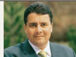
Bundesumweltminister Sigmar Gabriel Schirmherr der Spritsparstunde auf der AMI 2007

» Ich begrüße die Initiative des VDIK zum Klimaschutz und freue mich besonders, dass die AMI-Spritsparstunde in diesem Jahr mit einer Rekordbeteiligung von mehr als 25 Automobilmarken Zeichen setzt und dem Verbraucher deutliche Signale gibt, wie wichtig sein persönlicher Beitrag zur Energieeffizienz und damit zum Klimaschutz ist «