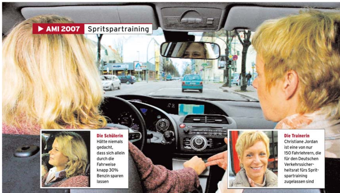
▶ AMI 2007 Spritspartraining