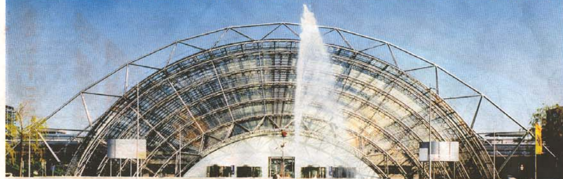
WASSER MARSCH Die Fontäne vor der Leipziger Messe ist Symbol für den Trend zu sauberen Autos. Man zeigt beispielsweise einen 7er, der mit Wasserstoff fährt und aus dessen Auspuff nur Wasser kommt.

Auf der Auto Mobil International (AMI) in Leipzig können die Messebesucher viele Autoneuheiten sogar selber fahren