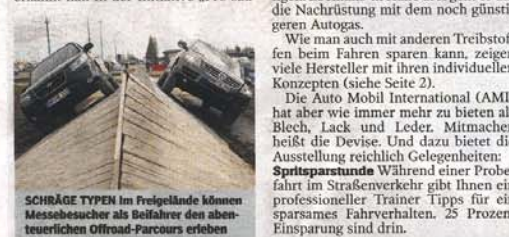
SCHRÄGE TYPEN Im Freige-lände können Messebesucher als Beifahrer den abenteuerlichen Offroad-Parcours erleben